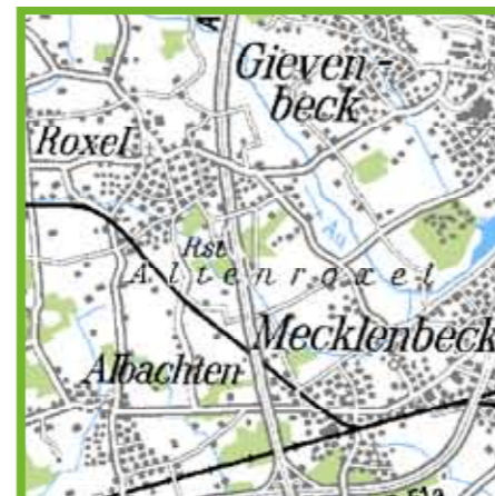
Zwischen Mecklenbeck und Roxel liegt das „Alte Gasthaus Lohmann“ – der legendäre Treff südlich von Münster