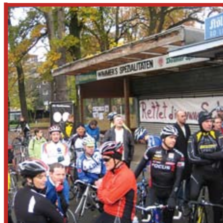
Herbst 2008: Über 100 Fahrer protestieren in Köln gegen die Schließung der Schmitzebud. Erfolgreich!