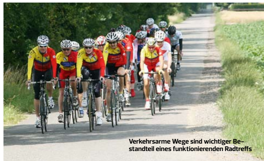
Verkehrsarme Wege sind wichtiger Bestandteil eines funktionierenden Radtreffs