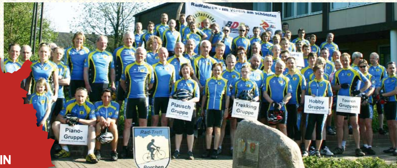
Borcheln: der größte Rad-sporttreff in NRW.

DIE NEUE SERIE STELLT IH-NEN DIE BESTEN RADTREFFS IN DEUTSCHLAND VOR.