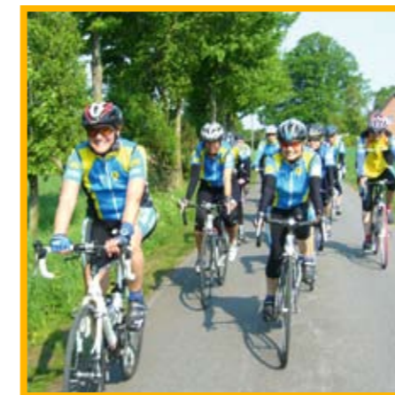
In Borchten liegt der Rekord bei 93 Teilnehmern. Neun verschiedene Gruppen fahren dienstags am Rathaus los